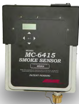
SENSOR INALÁMBRICO de HUMO