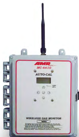
SENSOR INALÁMBRICO de GAS