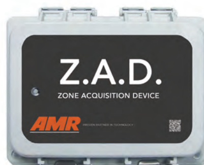
DISPOSITIVO de ADQUISICIÓN ZONAL