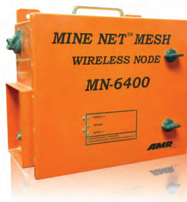
MINE NET™ MESH NODE