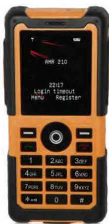
MINE NET™ TELÉFONO VOIP